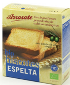
斯佩尔特小麦饼干